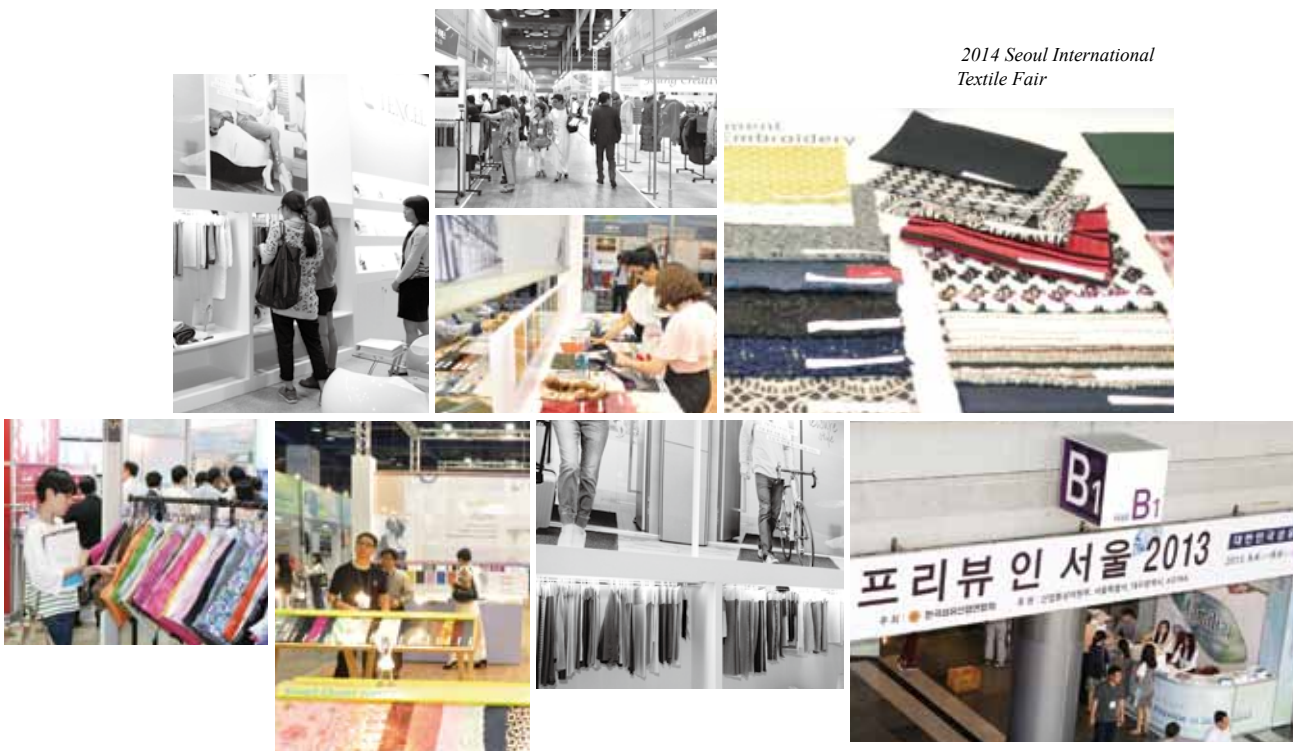
2014 Seoul International Textile Fair